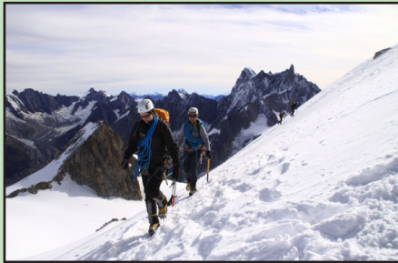
31 août : Pointe de Blonnière, Arête à Marion-escalade